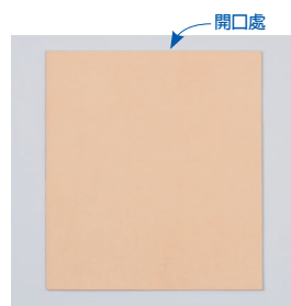
前期裁剪下的正面皮革